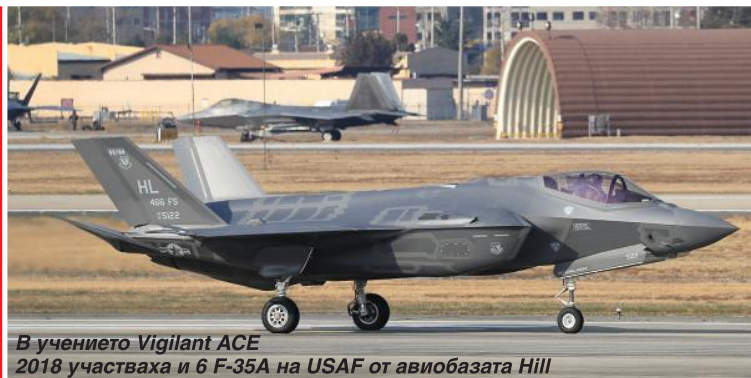
В учението Vigilant ACE 2018 участва и 6 F-35A на USAF от авиобазата Hill

въздушната база Суйон. Носейки прозвището „тигри“, пилотите от ескадрилата правят същите жестове с ръцете си, каквито може да се видят в Европа по време на NATO Tiger Meet. Ескадрилата действа „рамо до рамо“ с американските. Същата база, същата писта, но различни мисии.