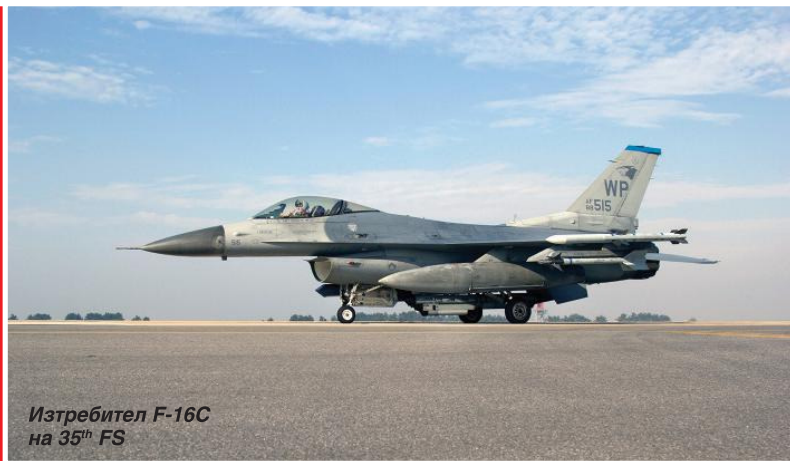
Изстребител F-16C на 35 th FS