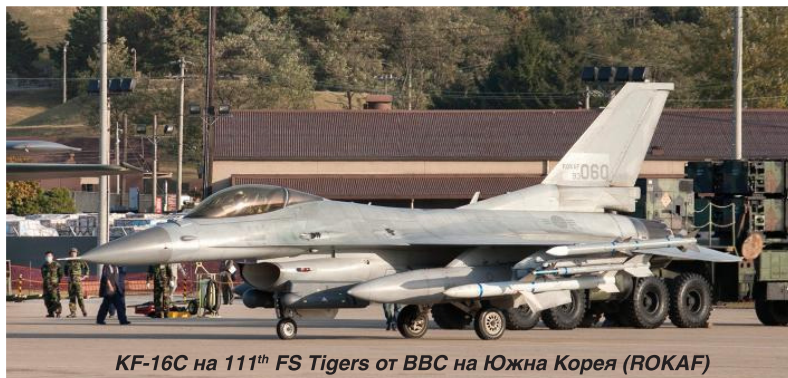
KF-16C на 111 th FS Tigers от BBC на Южна Корея (ROKAF)