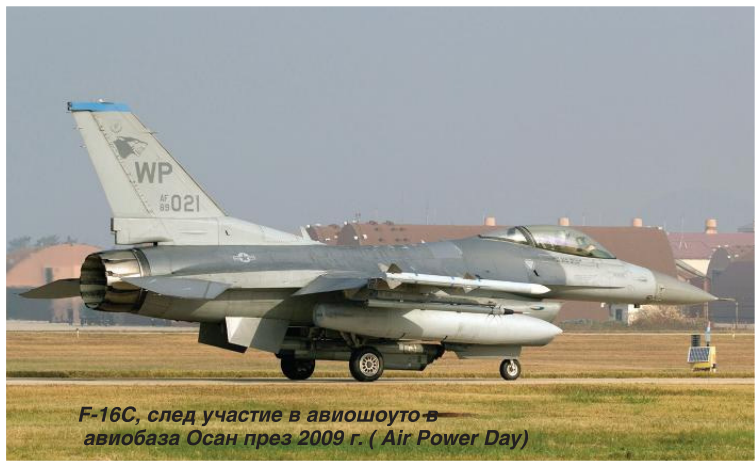
F-16C, след участие в авиошоуто в авиобаза Осан през 2009 г. (Air Power Day)